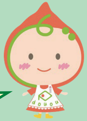
JA道央イメージキャラクター ©どんなちゃん

対象者：個人のお客様 対象商品：スーパー定期貯金(自動継続扱い) 預入期間：3年(複利型) 預入金額：1口100万円以上 預入条件：新規お預入れ貯金を対象とさせていただきます。 預入利率：店舗金利でお預かりさせていただきます。 ※令和3年7月1日現在の店頭金利は0.002%です。 ※1口の預入金額が1,000万円の場合でもスーパー定期での自動継続となります。